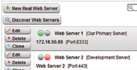
Définitions de serveur physique