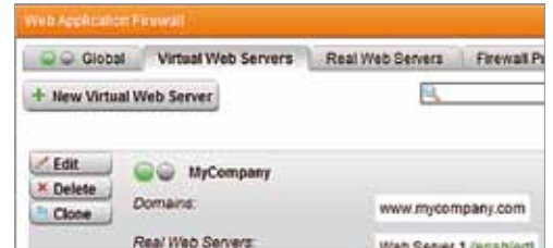
Mappage des serveurs virtuels