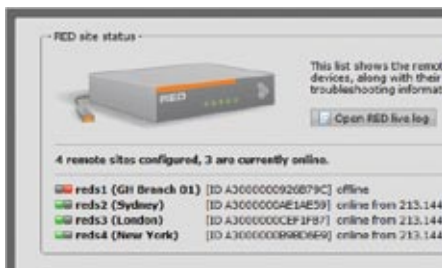
Liste des périphériques RED