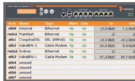
Intégration à un tableau de bord